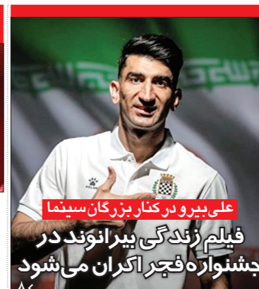
علی بیرو در کنار بزرگان سینما فایلم ژانگه‌گرکی بیرو نئونگ در جشنواره فجر اکران می‌شود