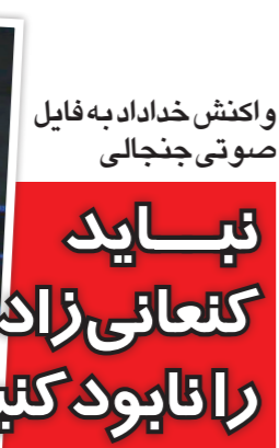
واکنش خداداد به فایل صوتی جنجالی