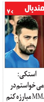
هندبال استکی: می خواستم در MMA مبارزه کنم