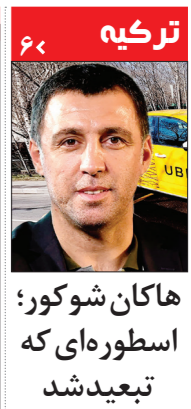
ترکیه هاکن شوکور؛ اسطوره‌ای که تبعید شد