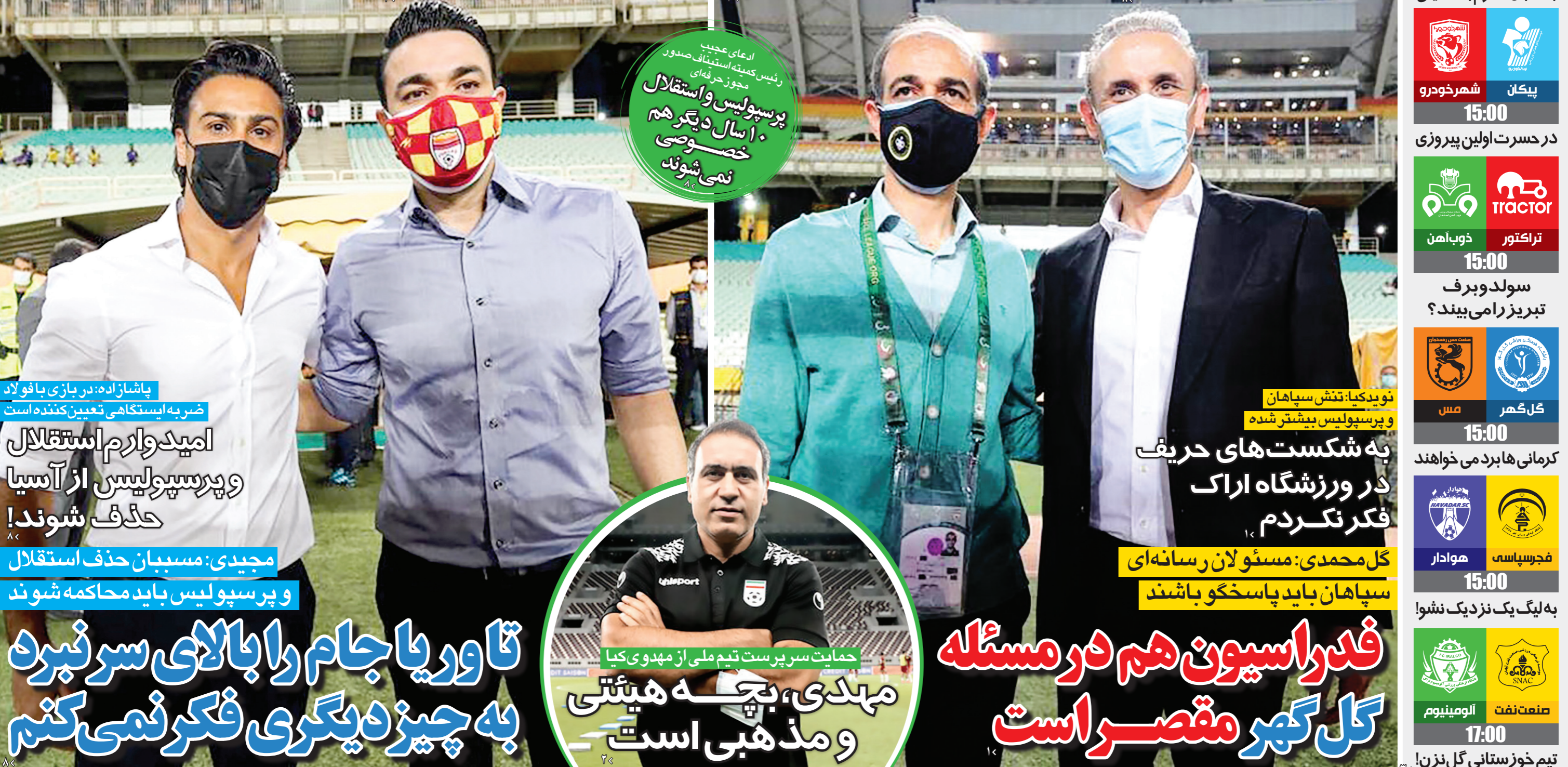
نویکیا، تنش سپاهان و پرسپولیس بیشتر شده