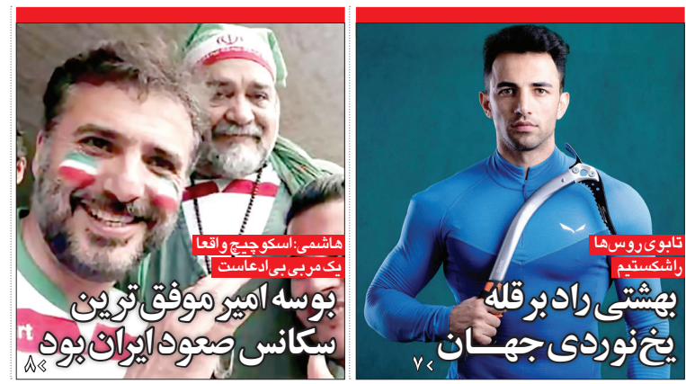
تایور سوخا را نشاندند / بهشتی راد بر قله یخ نوردی جهان / سکناس سعودی ایران بود / توماس امیر موفق ترین / توپه سی ارمانست / هاشمی اسکو چیچ و افغان