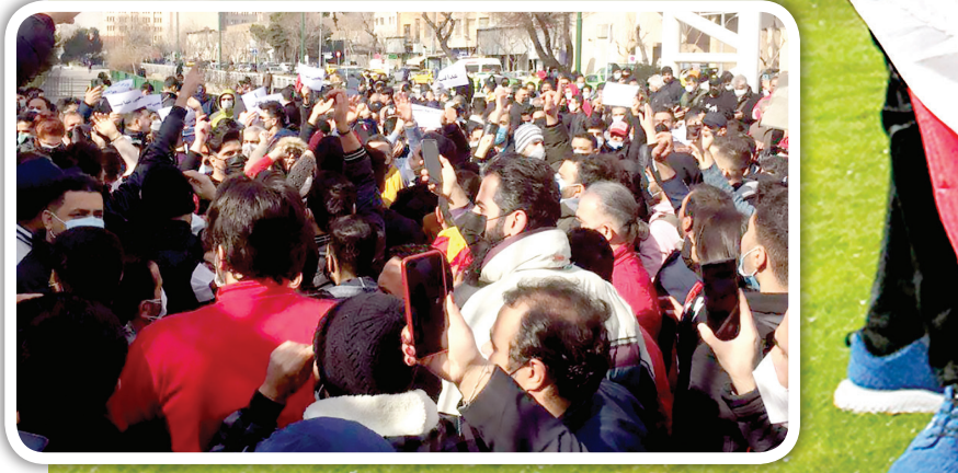
در تجمع هواداران پر سپولیس چه گذشت؟