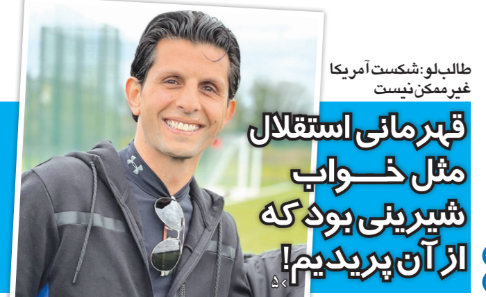
طالب لو: شکست آمریکا غیر ممکن نیست قهرمانی استقلال مثل خواب شیرینی بود که از آن پریدیم!