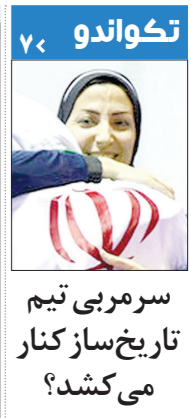
سر مربی تیم تاریخ ساز کنار می کشد؟