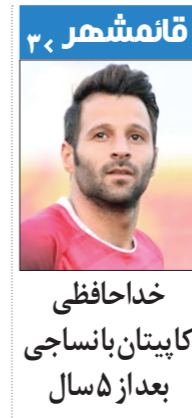
خداحافظی کاپیتان بانساجی بعد از ۵ سال