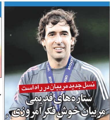
نسل جدید در بیان در راه است ستاره های قدیمی تبریز خوش فکر و وزنی