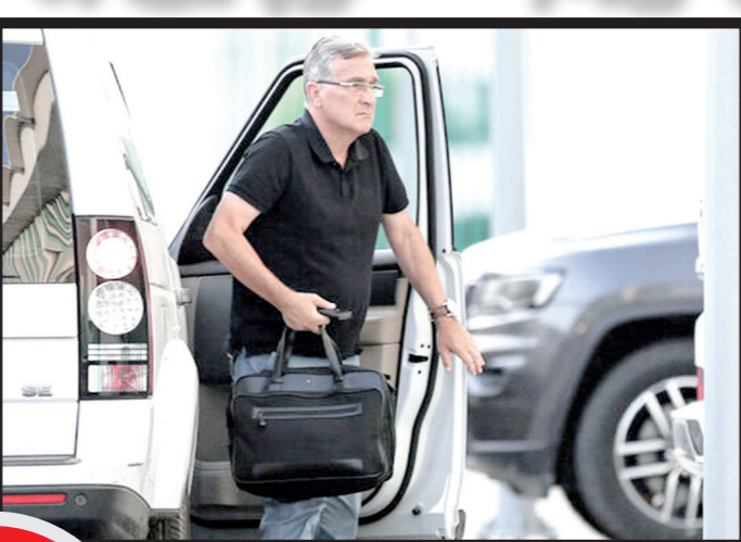
برانکو در گفت و گوی اختصاصی با خبرورزشی

نشان کرد: باز هم می گویم اسکوچیچ از کی روش بهتر است و عملکرد دو مربی مشخص است که من چرا از اسکوچیچ حمایت می کنم. در اگان تیم ملی ایران را زین صفر تحویل گرفت و همه به صورت قلعی از تیم نامید بودند و ایران را حذف شده می دانستند. به همین دلیل منتظر تاگامی اسکوچیچ بودند تا کاسه، کوزه ها را سر این مربی بشکنند. سسر مربی فعلی تیم ملی عمان ادامه داد: فوتبال ایران یکی مثل دادگان را می خواهد تا نشان فوتبال ایران را حفظ کند و فوتبال ایران آرامش داشته باشد. سرمربی سابق تیم ملی کشورمان و پرسپولیس درباره بدهی مالیاتی پنج ساله اش، عنوان کرد: من ۱۲ میلیارد بدهی مالیاتی دارم اما چند