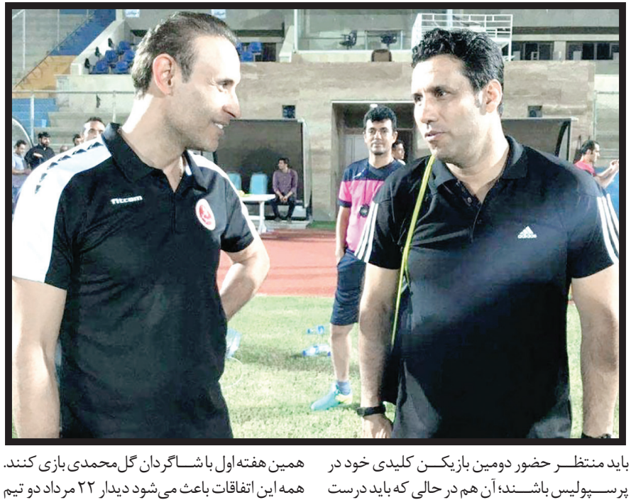
همین هفته اول باشگاه گل محمدی بازی کنند. همه این اتفاقات باعث می شود دیدار ۲۲ مرداد دو تیم پرسپولیس باشند، آن هم در حالی که باید درست

داغ تر شود و طبعاً انگیزه های تارتار هم برای گرفتن امتیاز از پرسپولیس بیشتر می شود. در شرایطی که قرار شده فقط ۲۰ درصد ظرفیت ورزشگاهها در اختیار فوتبالدوستان قرار بگیرد، مسلمان هواداران پرسپولیس برای دیدن ترکیب جدید تیم شان لحظه شماری می کنند. جالب اینکه پرسپولیس هفته دوم بازی حساس دیگری با تیم جوان نئونام دارد که حالا رو باغوری، کاپیتان سابق استقلال را هم به خدمت گرفته است. وریا در پرواز اعلام کرد با تمام وجود و برای سربلندی تیم جدیدش می جنگد و طبعاً حضور او در ورزشگاه آزادی و مقابل هزاران پرسپولیسی از جدیت های هفته های ابتدایی لیگ جدید است.